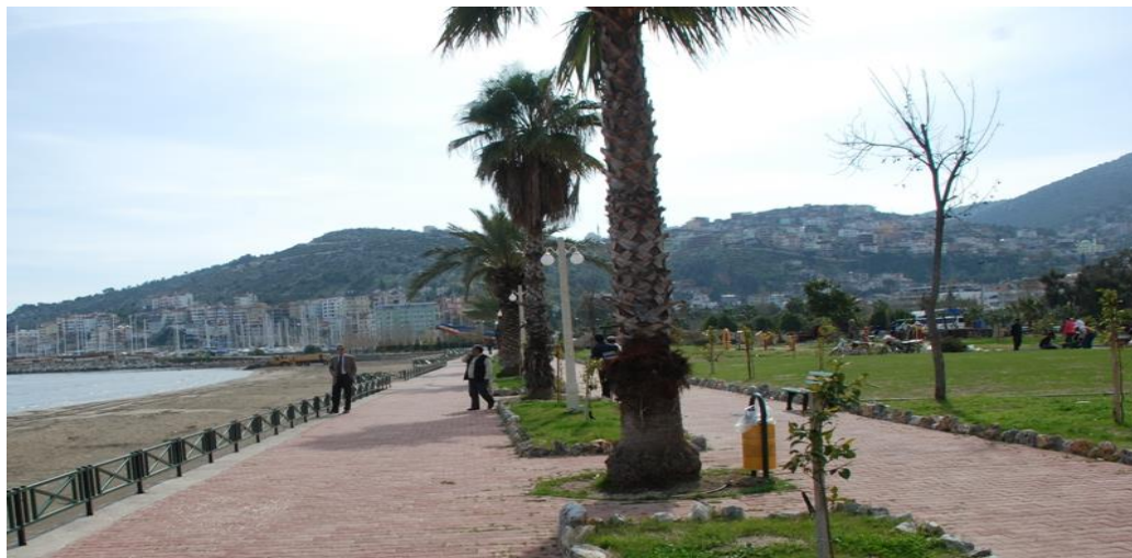
Çevre düzenleme-Yeşil alan