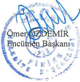
Ömer ÖZDEMİR Encümen Başkanı

Belediyemiz sınırları içerisinde tapunun Finike İlçesi Kale Mahallesinde kain, 14 ada 148 ve 149 nolu parseller, 59 ada 24, 27 ve 35 nolu parseller, 197 ada 1, 2, 3, 4, 5 ve 6 nolu parseller, 198 ada 1, 2, 3, 4, 5, 6, 7, 8, 9 ve 10 nolu parseller, 199 ada 1, 2, 3, 4, 5, 6 ve 7 nolu parseller, 200 ada 1 ve 2 nolu parseller, 217 ada 1, 2, 3 ve 4 nolu parseller, 218 ada 1, 2, 3, 4, 5, 6, 7, 8, 9, 10, 11, 12 ve 13 nolu parseller, 233 ada 1, 2, 3, 4, 5, 9, 10 ve 11 nolu parseller, 339 ada 5, 6, 7 ve 8 nolu parseller ve Karşıyaka Mahallesi 230 ada 1, 2, 3, 4, 5 ve 6 nolu parsellerin bulunduğu alan için hazırlanmış olan 3194 sayılı imar kanununun 18. Maddesi uygulaması plan yapım ve yönetmeliklerine uygun olarak işlem dosyası hazırlanmış olup, uygulamanın Belediye Encümenince kabul edilerek uygulama dosyasının Antalya Büyükşehir Belediyesinin onayına sunulması, Finike Belediye Encümeninin 06.08.2025 tarihli toplantısında oy birliğiyle uygun bulunmuştur.